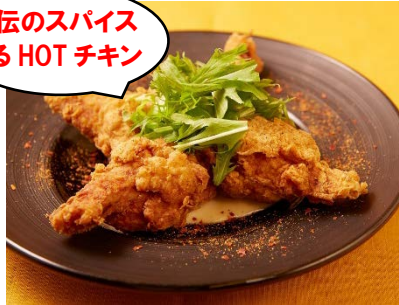
「悪魔の骨付きスパイシーチキン」 ¥1,296(肉屋 格之進 F) アーキヒルズサウスタワー B1F

秘伝のスパイスミックスをたっぷり使った衣でパリッと焼いた骨付きのチキンに、さらにオリジナルスパイスをかけました。香ばしくジューシーな味わいとスパイシーな辛さがやみつきに！