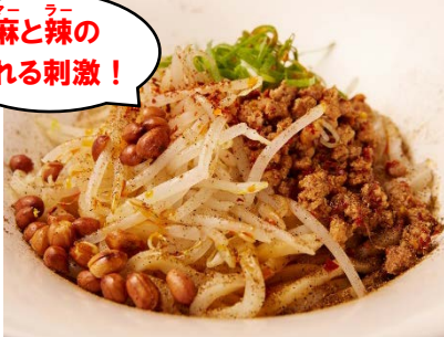
「鬼シビレ汁なし坦々うどん」 ¥970 (創作うどんとおでん居酒屋 あんぶく) 虎ノ門ヒルズ 4F

濃厚な胡麻ベースのタレに肉味噌、モヤシ、青ネギ、ピーナッツを合わせた坦々うどん。日本の青山椒、中国の花山椒の2種類の山椒を使用し、麻(マー)と辣(ラー)もプラス。辛さも4段階から選べます。