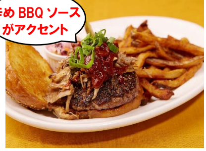
「BBQ プルドポーク バーガー」 ¥1,900(Bubby's New York ARK Hills) アーキヒルズ 2F

豚の肩肉の塊を低温でスモークし、ほぐしたプルドポークを、100%ビーフのパティの上にたっぷりとのせたボリューム満点のハンバーガー。スパイスを加えて煮込んだ辛めのBBQソースはクセになる美味しさです。