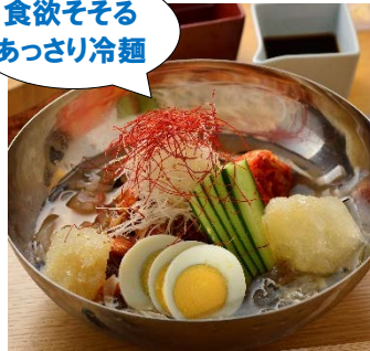
【左】「アボカド涼麺」ランチ¥2,000、ディナー¥2,160 (華都飯店) アーキヒルズ 仙石山森タワー B2F

アボカドと巻き海老を使った夏にピッタリの冷麺。アボカドの風味と練り胡麻のコクを生かし、シンプルに塩で調えたまろやかなソースが秀逸です。揚げたカシューナッツと香草がアクセントに。