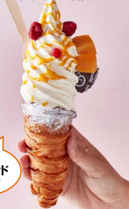
[1] 六本木ヒルズ店限定

今年のトレンドカラー“黄色”を配したスイーツが大集結！甘酸っぱいレモンやトロピカルなマンゴーなどのフルーツと、ソフトクリームやかき氷、スープなど、フォトジェニックなビジュアルが際立つメニューが目白押し。SNS映えも抜群です。