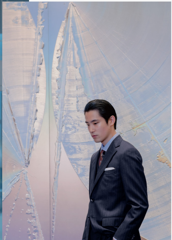
大庭大介 / Oba Daisuke 《M》(detail) 2022 STATION TOWER B2F-3F SHUTTLE ELEVATOR HALL